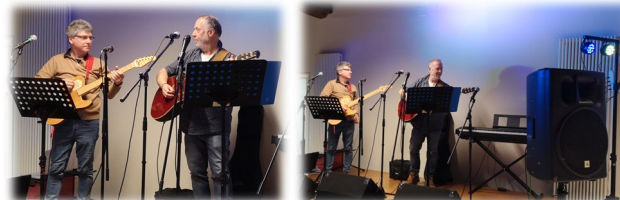
02 mars Soirée cabaret Les Musicaux