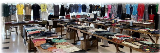
10 février Foire aux bonnes affaires AFF