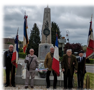
08 mai Commémoration