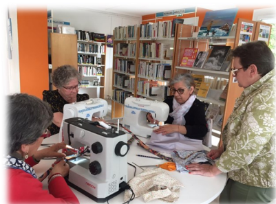
07 mai atelier couture la Farandole