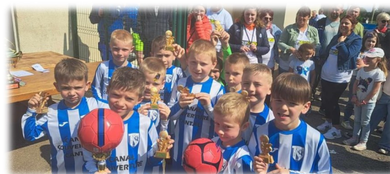
20 mai tournoi des jeunes ASO