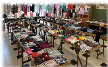
13 avril Foire aux bonnes affaires AFF