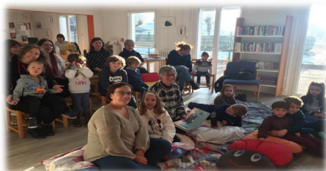
20 janvier Heure du conte La Farandole