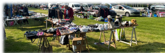
01 avril Foire à tout ASO