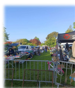
09 mai Foire a tout ASO