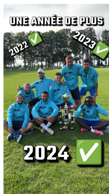
30 juin Tournoi de sixte ASO