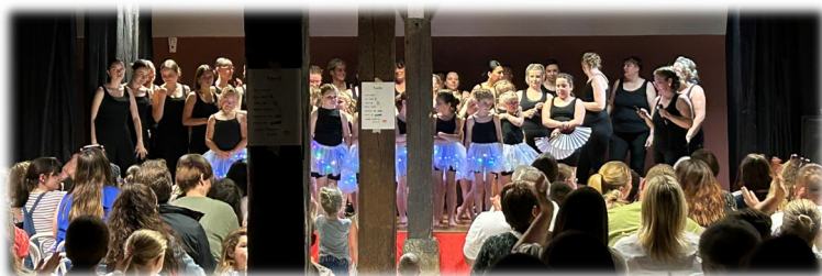
25 mai Spectacle de danse Les Goya