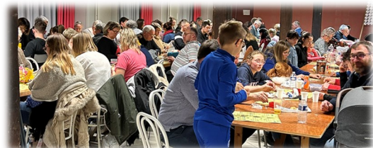
15 mars Loto ASO