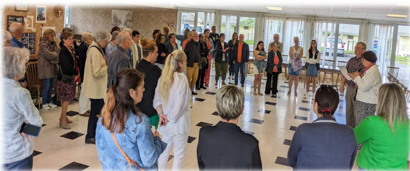
26 mai Fête des mères Commission des fêtes