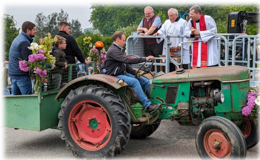
20 mai Bénédiction tracteurs Paroisse