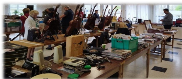
28 avril Foire à tout musicale Les Musicaux