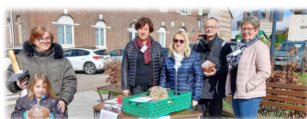
16 mars Vente de brioches Commission des fêtes