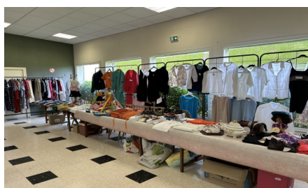
08 juin Foire aux bonnes affaires AFF