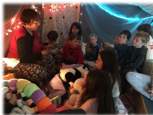
04 juin pyjama party la Farandole