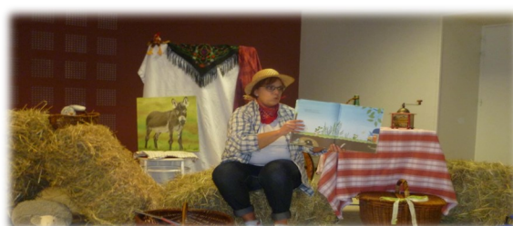
10 février Spectacle La Farandole