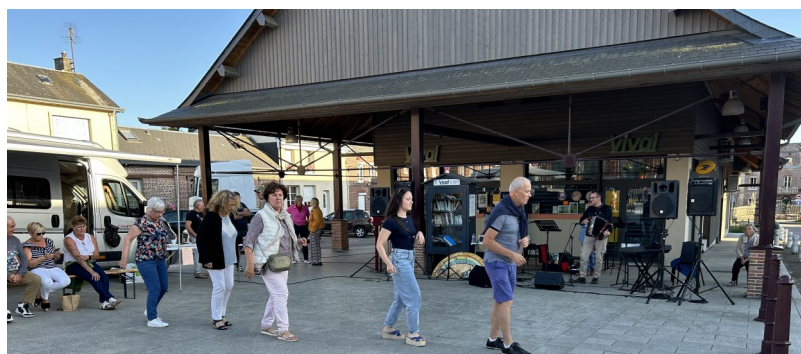
28 juin Fête de la musique Les Musicaux