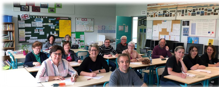
25 mai Dictée La Farandole et le club de l'âge d'or