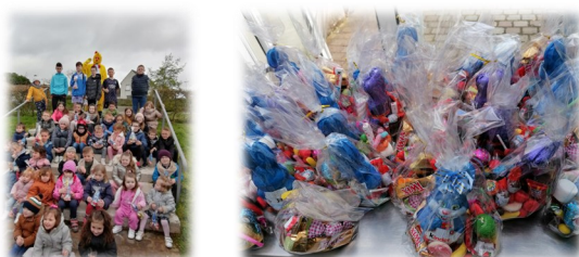
01 avril Chasse aux œufs Commission des fêtes